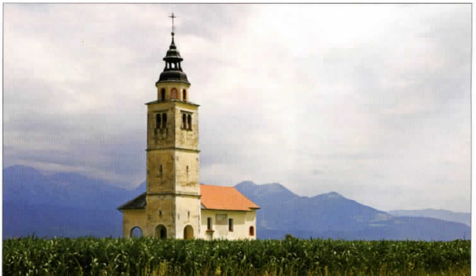
Kranj est une ville historique tout à fait pittoresque située sur une saillie rocheuse, entre les rivières de montagne Sava et Kokra.