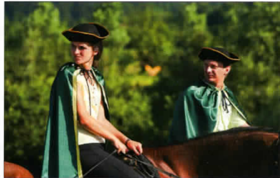
Une cérémonie en tenue traditionnelle qui souligne l'importance de l'art équestre en Slovénie.