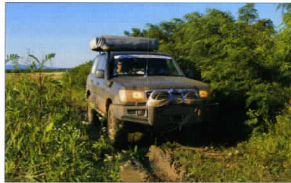
Un exemple très explicite du potentiel d'excursions tout-chemin sur le territoire slovène avec Orpist'.