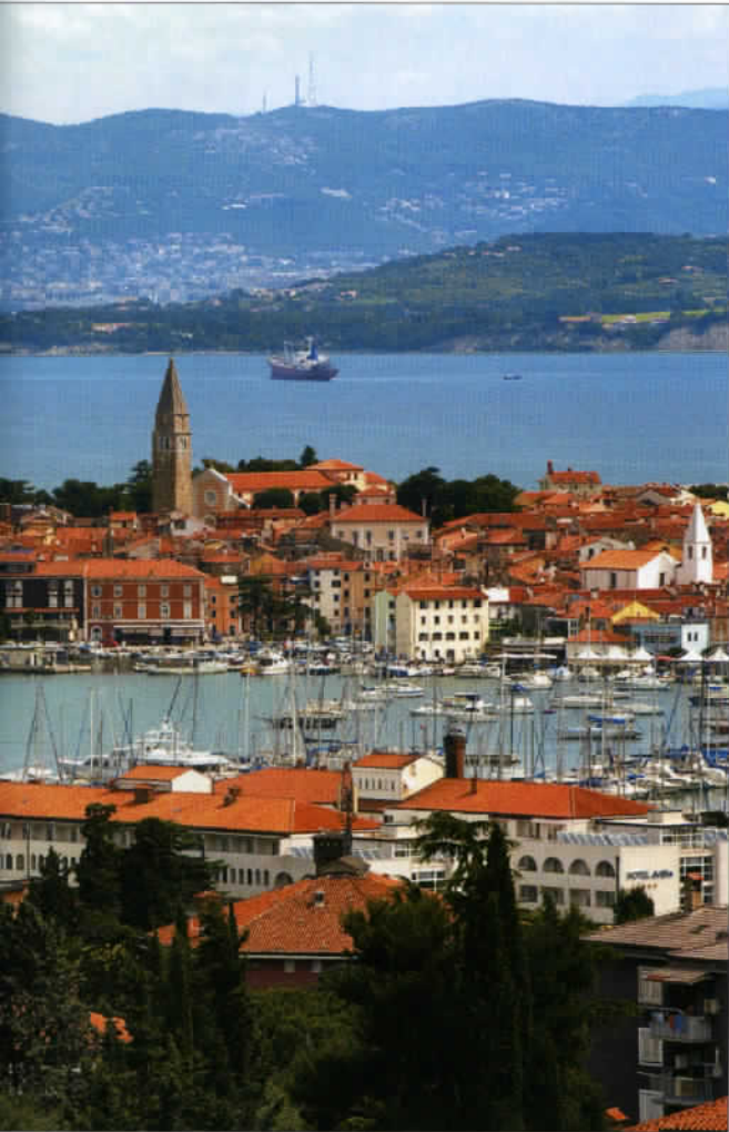
Izola, près de Piran, l'une des plus belles cités médiévales de Slovénie, construite sur le splendide littoral de la côte Adriatique.