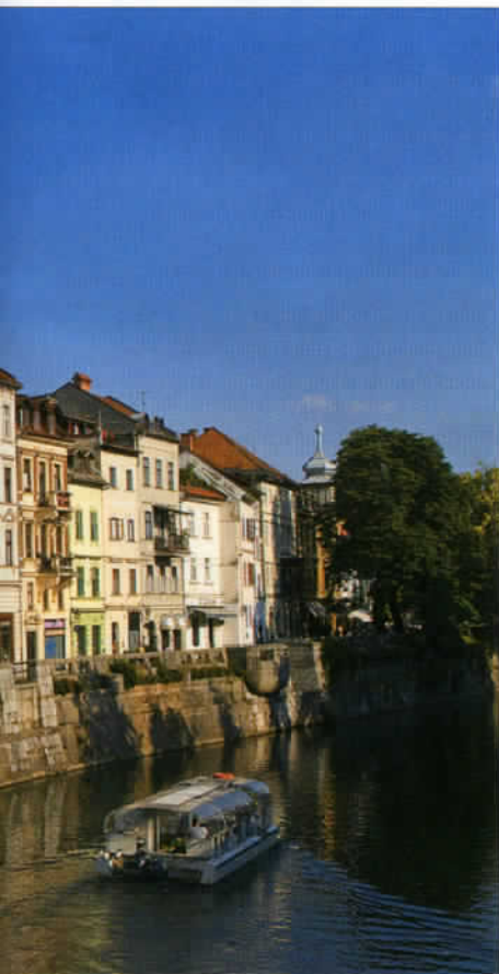
De paisibles promenades fluviales sont possibles à Ljubljana, sur le Ljubljanica qui traverse la capitale slovène.