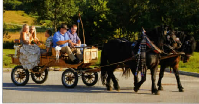
Au pays des chevaux Lipizzans, que l'on retrouve à la célèbre l'École espagnole d'équitation de Vienne, les balades en calèche sont toujours très appréciées.