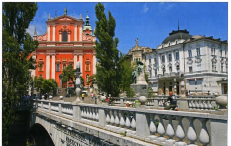
Tromostovje ou les Trois Ponts, la curiosité architecturale de Ljubljana, œuvre de l'architecte Jože Plečnik dont l'achèvement remonte à 1931.