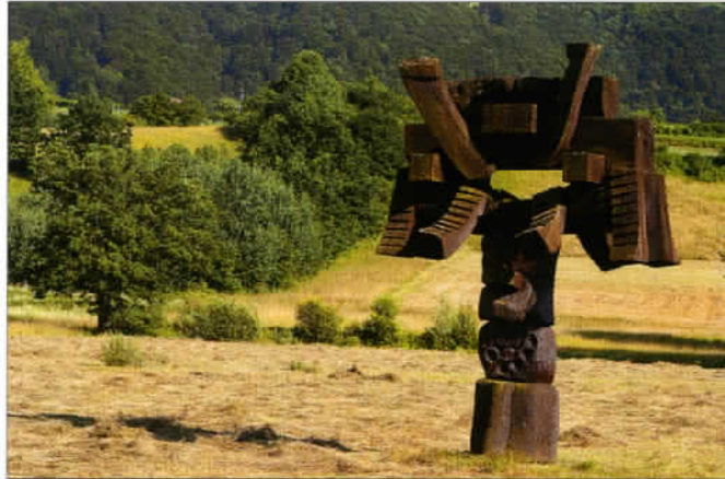
Une sculpture de l'exposition en plein air « Forma Viva », dans le parc attenant au monastère cistercien de Kostanjevica.