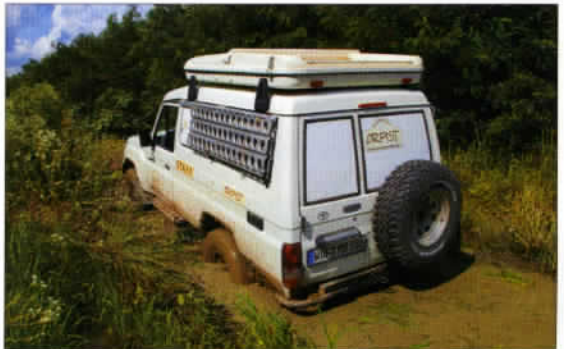
Un véhicule d'Orpisk en pleine action sur l'un de ses terrains de dilection !