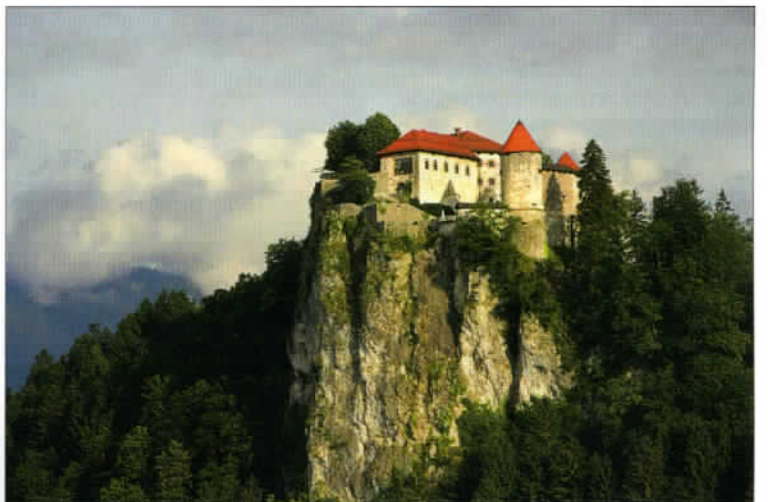
Le château de Bled, juché sur un éperon rocheux en surplomb d'un lac un tantinet féerique... Un vrai paysage idyllique.